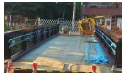
<平らで広くなった人道橋>