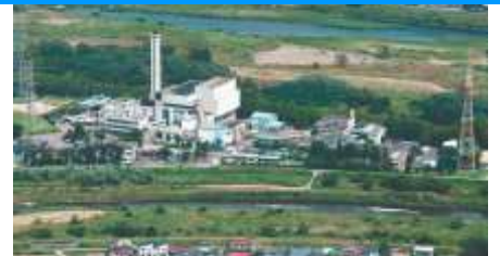
<現在の日野市クリーンセンター>

7月1日、日野市・国分寺市・小金井市の可燃ごみの3市共同処理に向けて、新可燃ごみ処理施設の設置及び運営を共同で行うことを目的とした一部組合「浅川清流環境組合」が設立されました。新ごみ処理施設建設予定地の日野市クリーンセンター周辺にお住いの皆様を始めとした日野市民の皆様のご理解とご協力に心より感謝申し上げます、引き続き全力で取り組んでまいります！